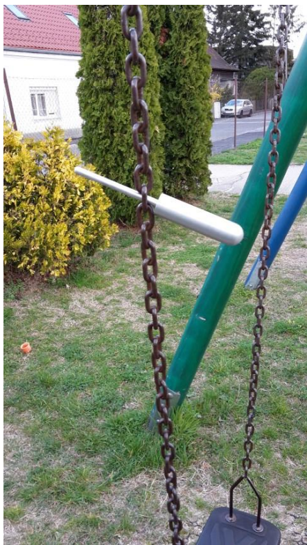
Prvok č. 4 – zachytenie prsta, nohy